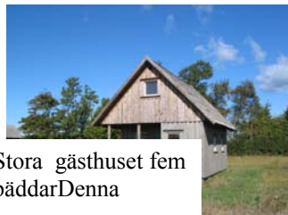
Stora gästhuset fem bäddar Denna