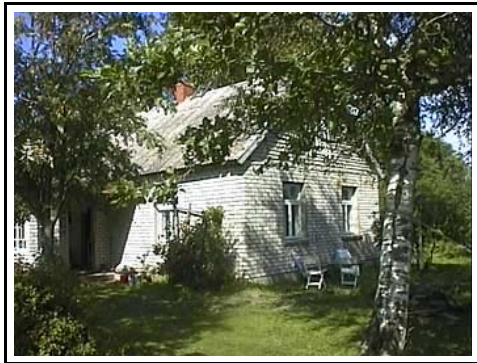
Huset ligger bara 150m från en härlig sandstrand