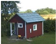
Lilla gäststugan fyra bäddar